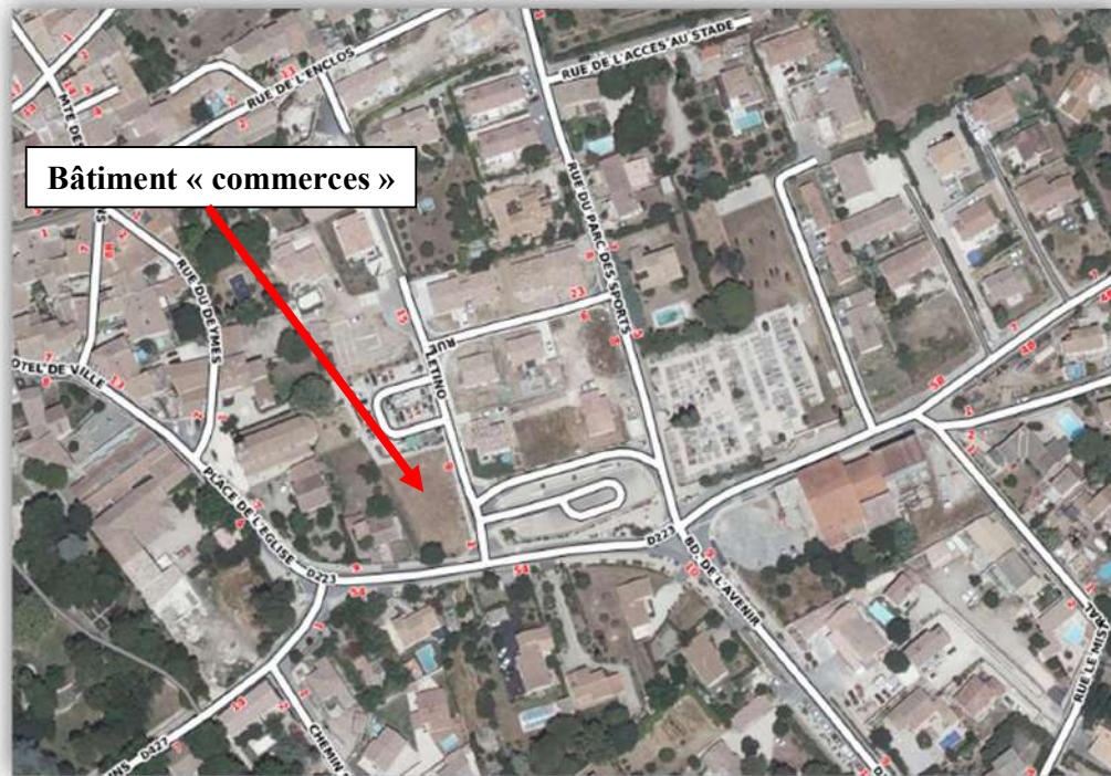
Situation géographique du bâtiment